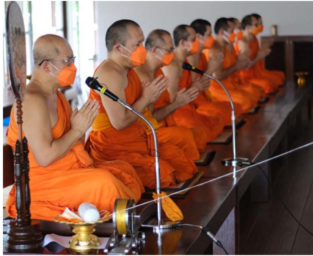
พิธีสวดพระพุทธรูปมนต์ ในวันฌาปนกิจ ที่ญาณเวศกัธรรมศาลา วัดญาณเวศกวัน