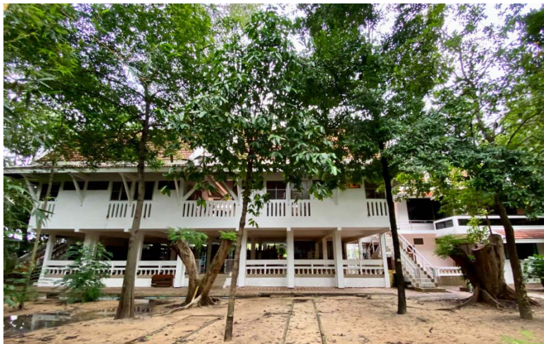
กฤษิต ภาพถ่ายด้านทิศตะวันตก