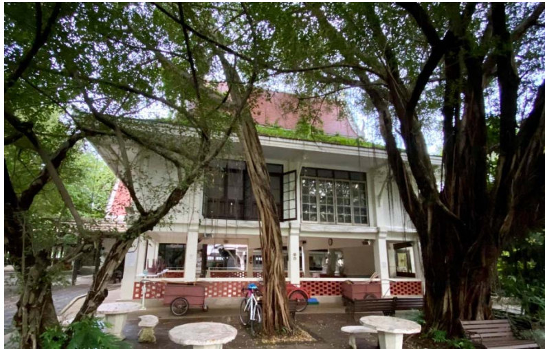
ศาลาอเนกประสงค์