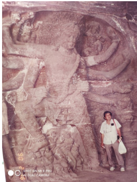
ในถ้ำหนึ่งของอินดู แห่ง Ellora ก.พ. ๒๕๓๓