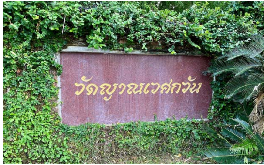
ตราวัด และป้ายชื่อวัด อยู่สองข้าง ปากทางเข้าวัด