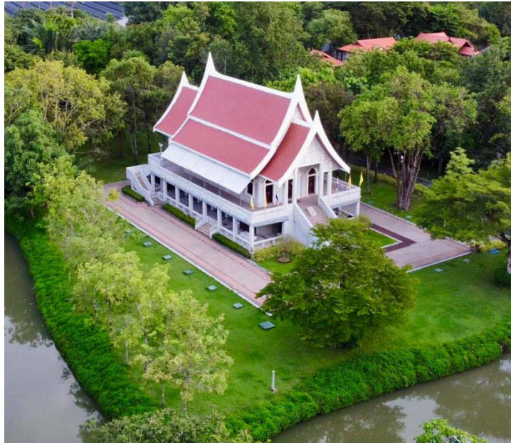
อุโบสถวัดญาณเวศกวัน สร้างเสร็จ สิ้นปี ๒๕๔๑