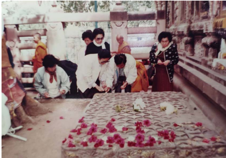
ปิดทอง ที่พระแท่นวัชรอาสน์ ร่มโพธิ์ตรัสรู้ ก.พ. ๒๕๓๓