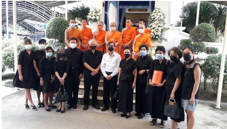
ณ ฌาปนสถาน วัดเครือวัลย์ฯ