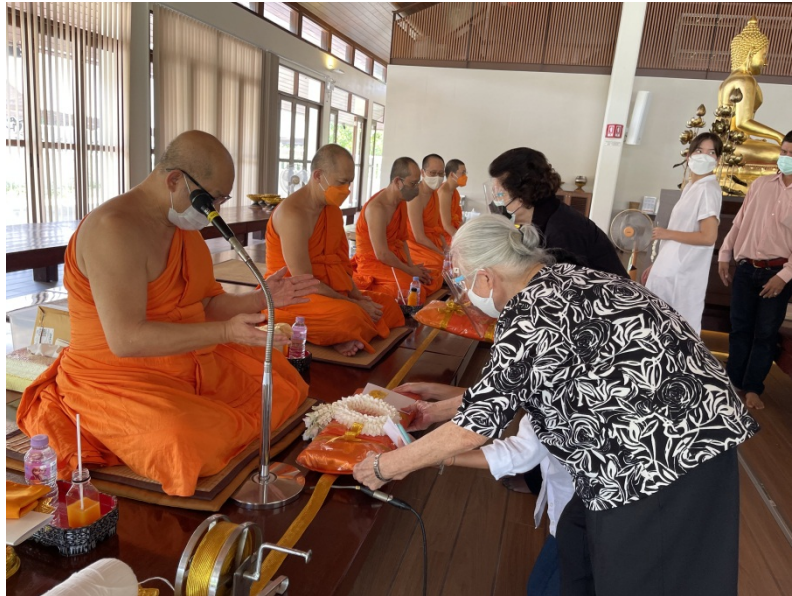
ทำบุญ ๕๐ วัน ที่วัดญาณเวศกวัน ๑๔ ตุลาคม ๒๕๖๔