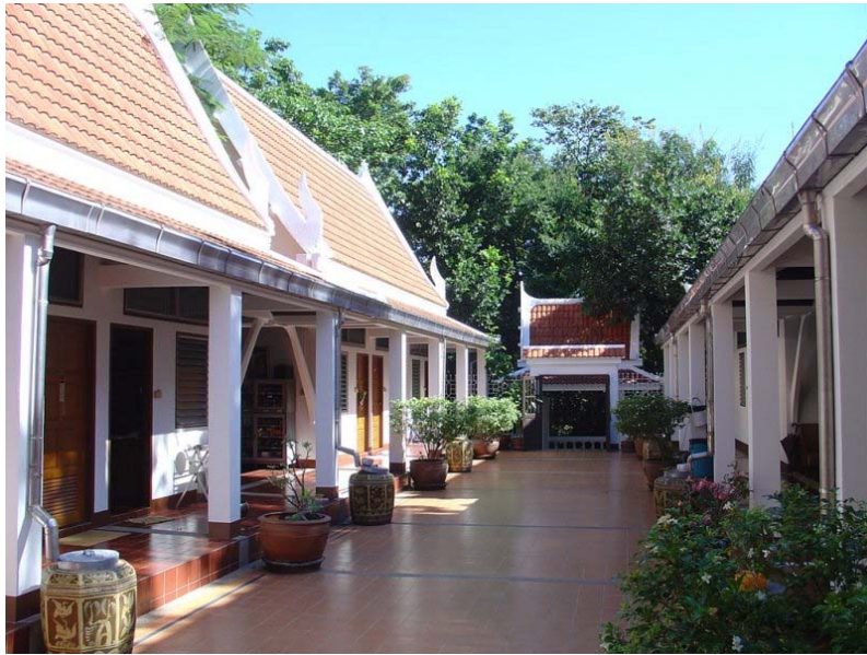
กุฏิชุดชั้นบน ๒ แถบๆ ละ ๒ หลัง รวม ๔ หลัง ๑๒ ห้อง