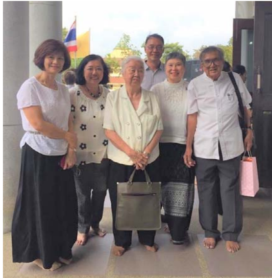
หน้าอุโบสถ ที่ได้ดูแลการก่อสร้าง สำรวจตรวจงานในบริเวณวัด